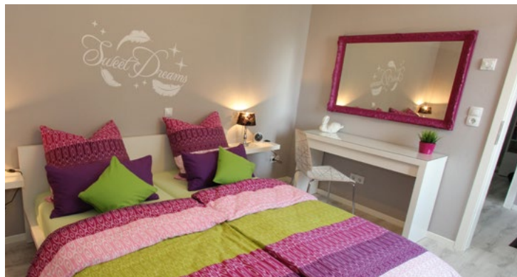
Ferienwohnung „Holmer Ausblick“, Schleswig

Am 2. März 2015 öffnen landauf, landab ausgesuchte Betriebe ihre Räume für andere Gastgeber. Diese Best Practice Beispiele finden Sie auf: www.designkontor.sh-business.de Eine Anmeldung ist dort auch möglich.