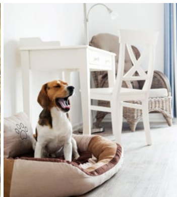
Hotel Pharisäerhof, Nordstrand