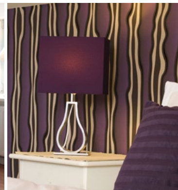
Baltik Kunsthôtel, Timmendorfer Strand