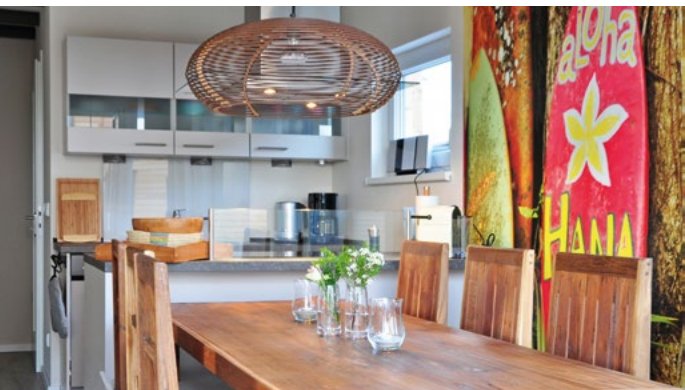
Kailua Lodge Pelzerhaken, Neustadt in Holstein