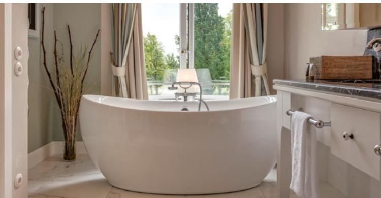
WEISSENHAUS GrandVillage Resort & Spa am Meer,Wangels