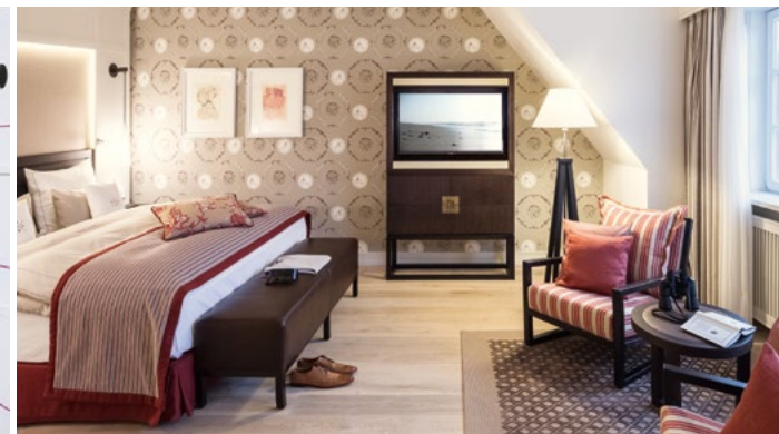
SEVERIN*S RESORT & SPA, Keitum